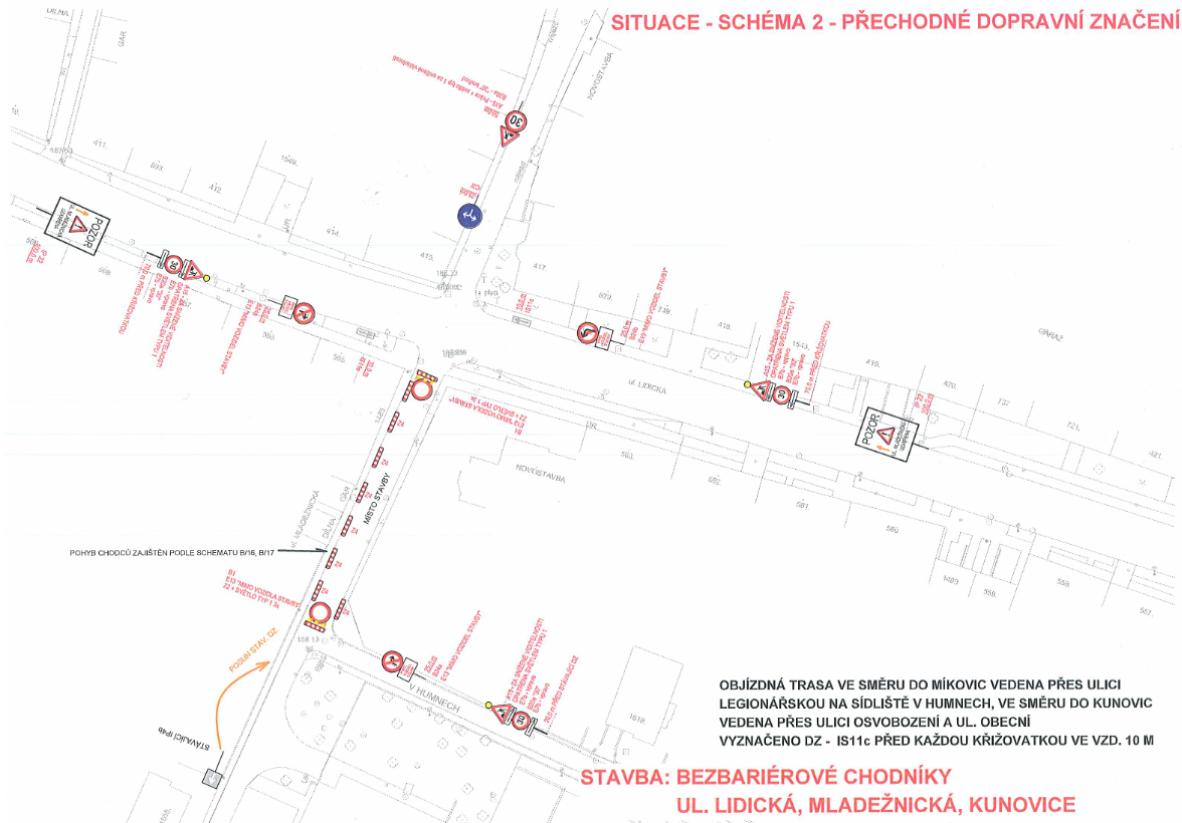
Schéma objízdných tras:

2. etapa: květen - červen 2019: realizace stavebních objektů SO 102 a SO 101 v úseku ul. Mládežnická od ul. V Humnech po ul. Lidická a chodník na ul. Lidická